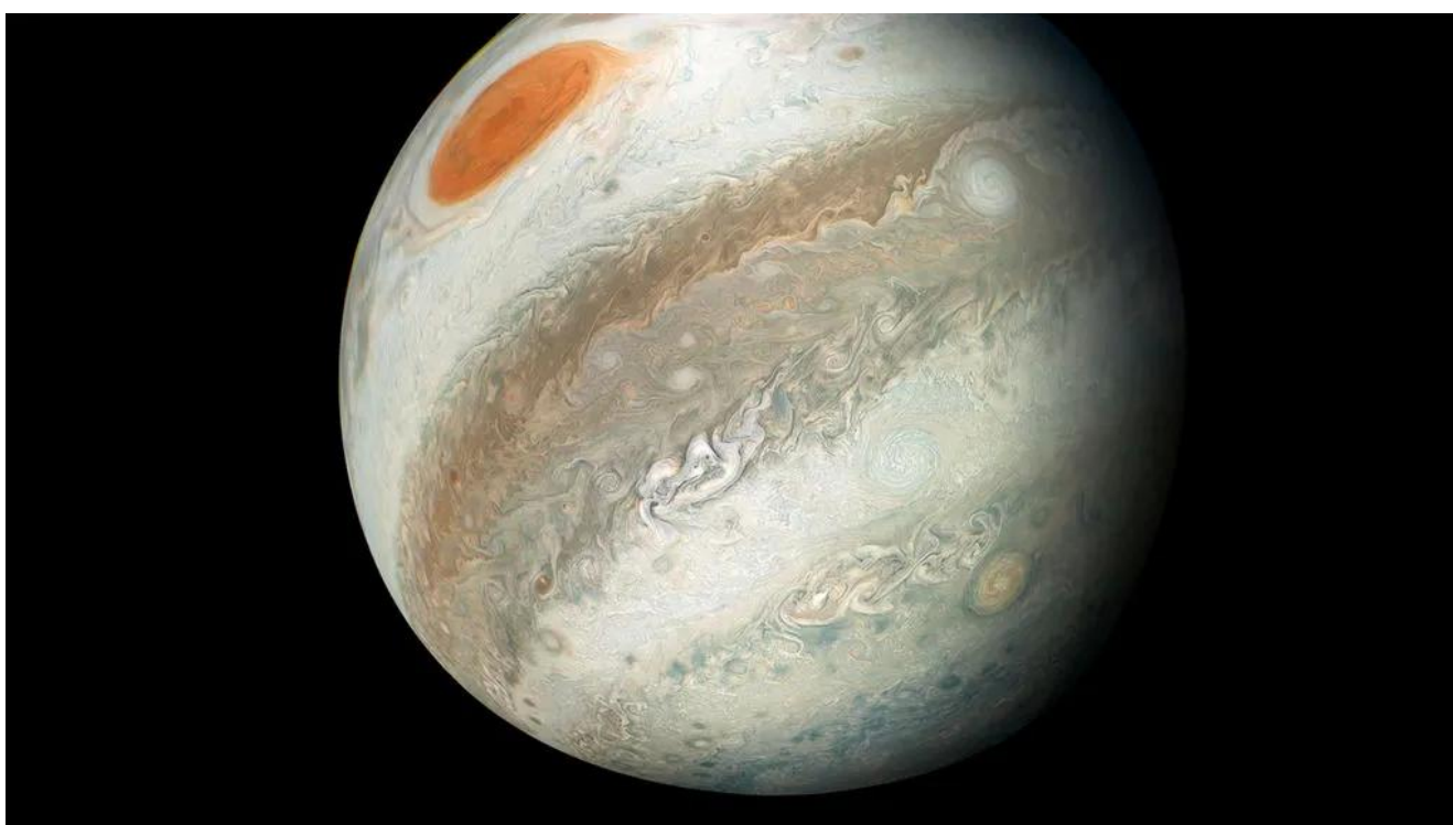
Imagem da Nasa de Júpiter de 2 de junho de 2020

Este artigo é uma das cartas recebidas de Victorien Sardou a respeito de Júpiter.