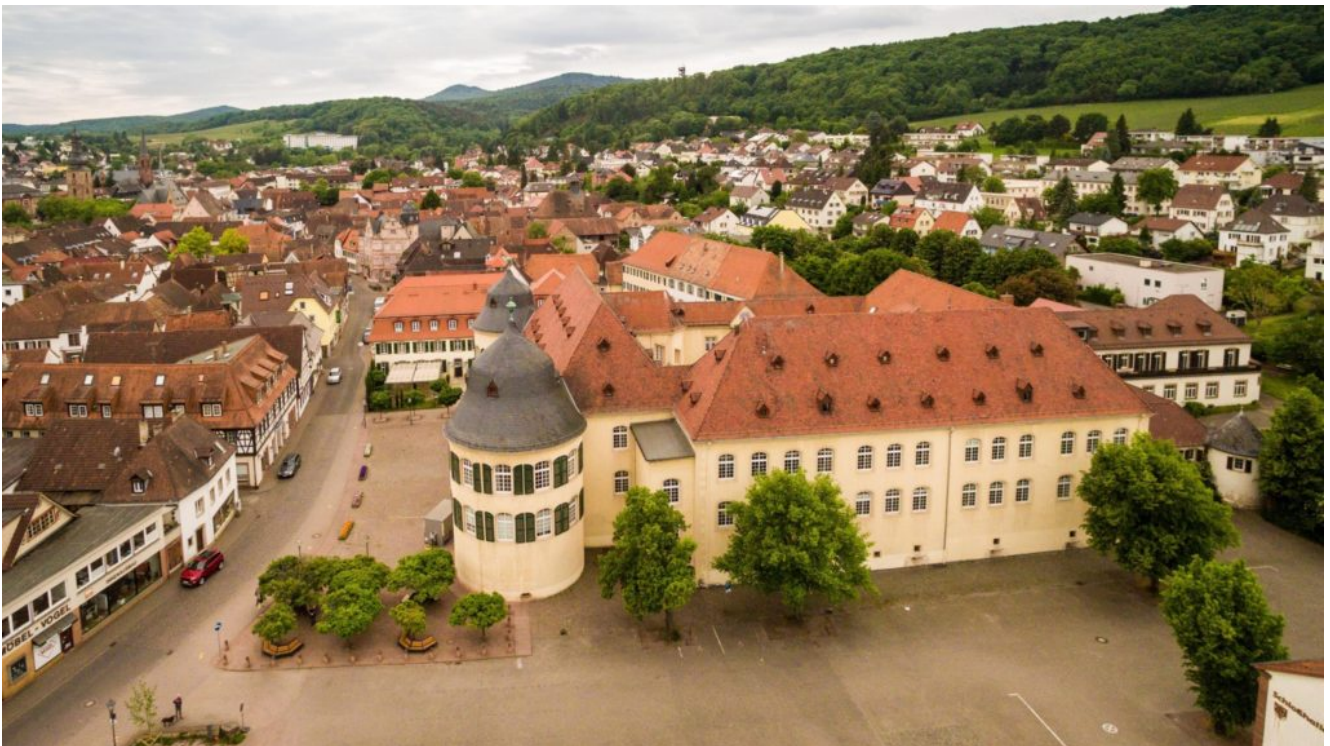
Vista da cidade de Bergzabern, na Alemanha.

foi todo abalado. Esses golpes se manifestaram de todos os lados da cama, ora num, ora noutro lugar. Pancadas e arranhões alternavam-se. A uma ordem da menina e das pessoas presentes, ora os golpes se ouviam no interior da cama, ora externamente. De repente o leito levantou-se em sentidos diferentes, enquanto os golpes eram desferidos com força. Mais de cinco pessoas em vão tentaram repor o leito no lugar, e quando desistiram da tentativa, ele ainda se balançou por alguns instantes, depois do que tomou a sua posição natural. Este fato já havia ocorrido uma vez, antes dessa manifestação pública.