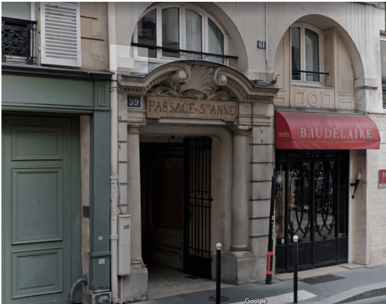
Passage Sanite-Anne, lugar que dava acesso àquela que foi a primeira sede da Sociedade Parisiense de Estudos Espíritas