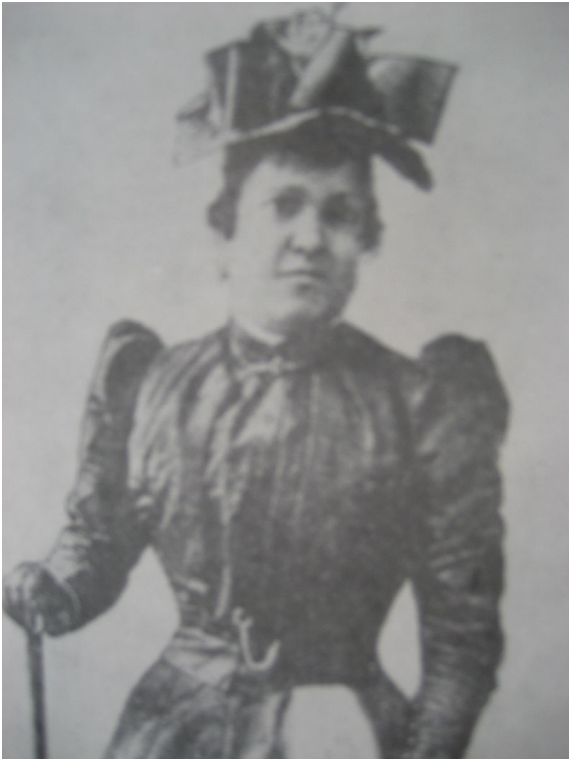
A médium Eusápia

Escreveu várias obras, tanto no campo da Medicina, quanto no da Filosofia. Dentre elas, destacam-se a notável monografia “Antropologia Criminal”, “L’Uomo di Gênio”, “L’Uomo Delinquente”, além de outras sobre psicologia e psiquiatria. Sobre o Espiritismo, não podemos deixar de citar a “Pesquisa Sobre os Fenômenos Hipnóticos e Espíritas”, através da qual relata todas as experiências realizadas, não só com Eusápia_Paladino, como também com outros médiuns de efeitos físicos, como Elizabeth D’Esperance e Politi.