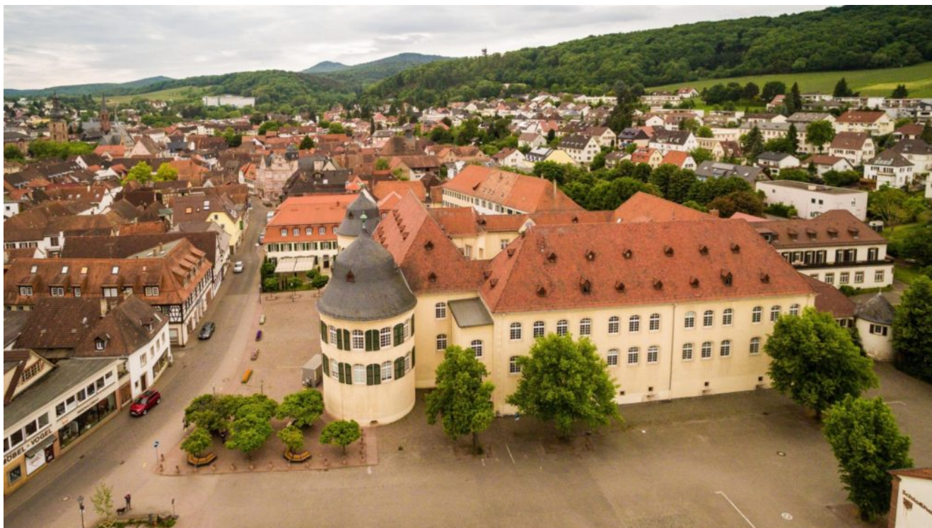
Vista da cidade de Bergzabern, na Alemanha.

golpes eram desferidos com força. Mais de cinco pessoas em vão tentaram repor o leito no lugar, e quando desistiram da tentativa, ele ainda se balançou por alguns instantes, depois do que tomou a sua posição natural. Este fato já havia ocorrido uma vez, antes dessa manifestação pública.