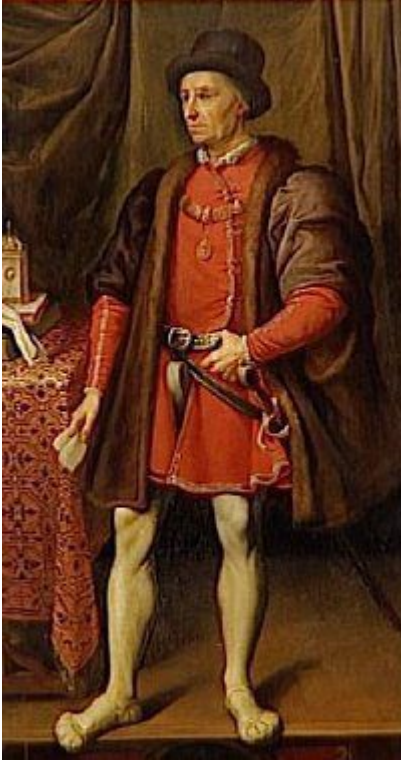
São Luís de França