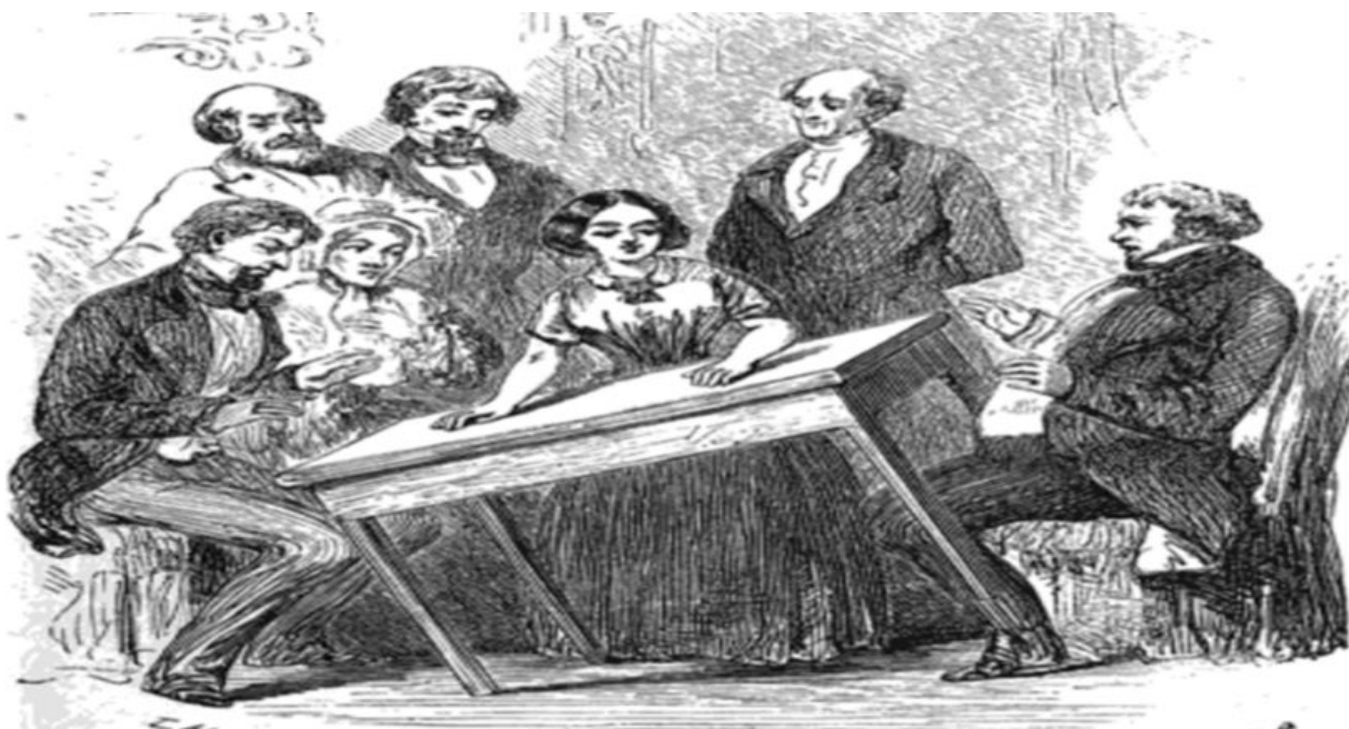
Teoria das manifestações físicas

Nos primeiros instantes que se seguem à morte, quando ainda existe união entre o corpo e o perispírito, este conserva muito melhor a impressão da forma corpórea, da qual, por assim dizer, reflete todas as nuances e mesmo todos os acidentes. Eis por que um supliciado nos dizia, alguns dias após a sua execução: Se me pudésseis ver, ver-me-íeis com a cabeça separada do tronco. Um homem que tinha sido assassinado nos dizia: Vede a ferida que me fizeram no coração. Pensava ele que poderíamos vê-lo.